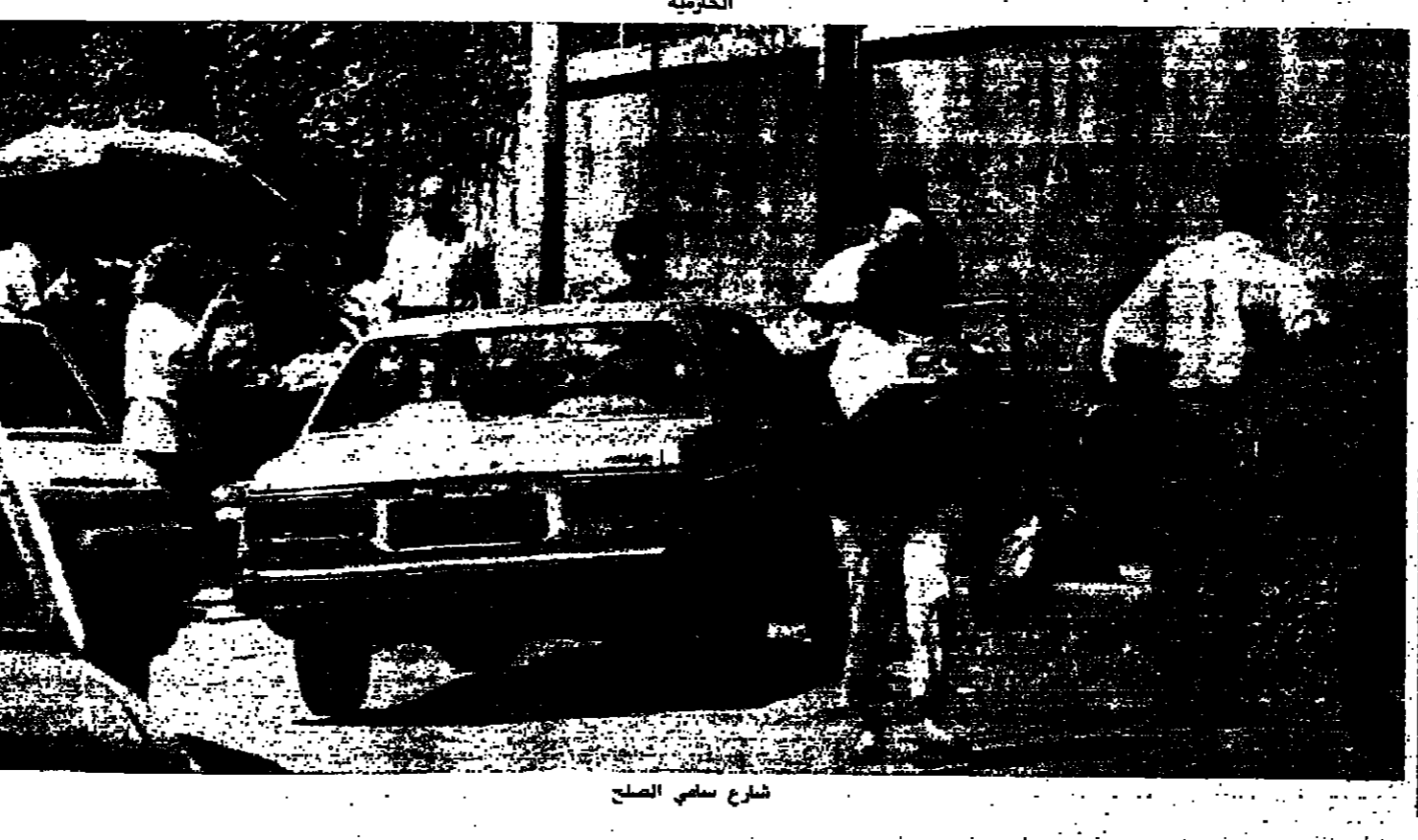
شارع سفي الصلح